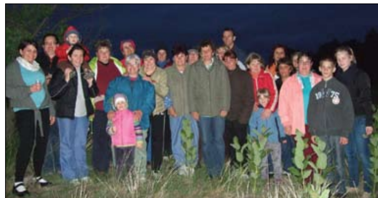
A Karitászcsoport tagjai segítő munkájuk mellett igazi közösségként működnek

A Karitászcsoport szervezett formában a Magyar Élelmiszerbank-