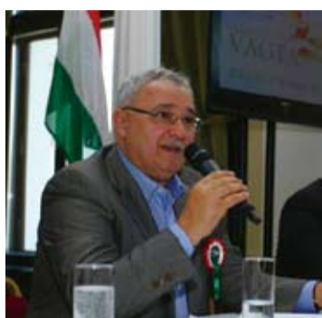
A szakági elnök ígéri, Izsák ismét kiváló házigazda lesz

A Nemzetközi Lovas Szövetség (FEI) elnöksége február 13-án Lozanban tartott ülésén döntött a 2014. évi egyesfogathajtó világbajnokság helyszínéről és időpontjáról. E döntés Izsák számára igen örömteli, hiszen szeptember 25-28. között városunk lesz a házigazdája az egyes fogathajtók világvérsenyének. Versenyzők, hazai és nemzetközi szakemberek, sportvezetők egyöntetűen kiválóra értékelték a tavalyi izsáki Európa-bajnokságot, annak megrendezését, lebonyolítását, a pálya minőségét, így okkal számíthatunk sikerre vb-pályázatunk benyújtásakor.