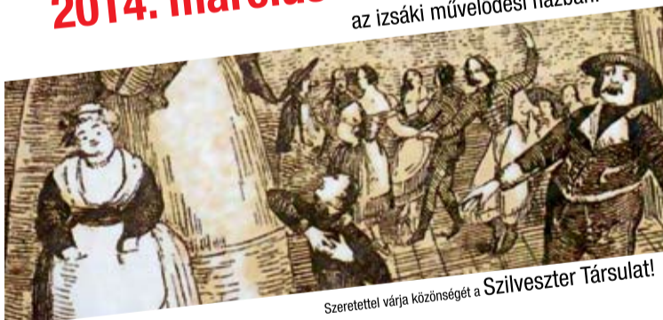
Szeretettel várja közönségét a Szilveszter Társulat!

2014. március 7-én 18 órákor az izsáki művelődési házban.