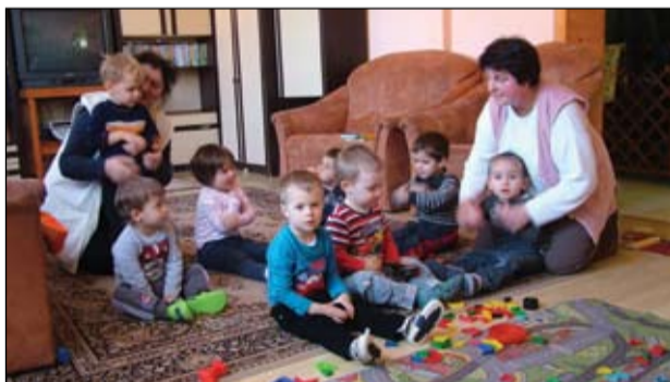
Családias hangulatban telnek a napok a „Törpikék-napköziben”