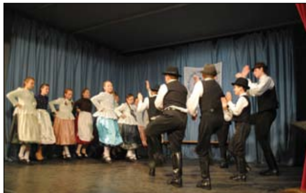
A „Szőlőszemek” egy dél-alföldi összeállítással arattak nagy sikert

Egyesületünk ezúton mond köszönetet minden ked-