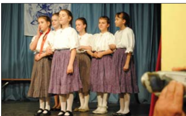
Az iskolai „Támop” csoport moldvait táncolt

A kezdeti jó hangulat az est végéig (másnap hajnaláig) kitarított rendezvényünkön, melyre méltán lehetünk büszkéek, hiszen színpadra lépett a Sárfehér Néptánc-együttes apraja-nagyja. Aki eljött a közel 300 főt vonzó eseményre a színvonalas műsor után sem unatkozott, hiszen vetélkedő és kézműves foglalkozás várta a gyere-