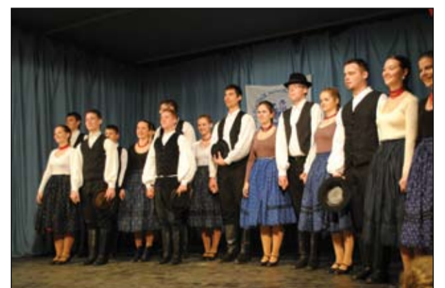
Szőlőfürt Csoport Kalotaszegi koreográfiával zárta a fellépők sorát