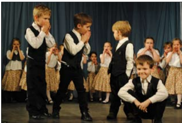
Az óvodások is megörvendeztették a közönséget: színpadon a Mazsola Csoport

A közös munka meghozta gyümölcsét, hiszen rengeteg embert sikerült az idei esztendőben is megmozgatni! A frissen felújított színpadon bizonyította tudását mintegy 100 fő táncosunk, az elmúlt félévben tanultakat közkincsé téve.