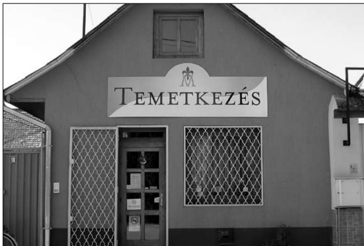
Izsáki iroda a Szabadság tér 18. szám alatt várja az ügyfeleket