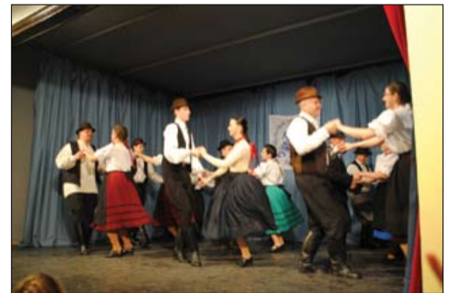
A „Szőlőtőkék” (felnőtt táncsoport) dél-alföldi csárdással lépett a színpadra

Köszönjük azoknak az anyukáknak, nagymamáknak munkáját, akik kivették részüket a terem díszítésében,