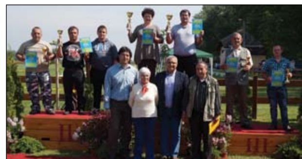
A főzőverseny eredménye, marhapörkölt: 1. Turcsán Lovastanya, 2. Varga Autókozmetika, 3. Hycomat Banditák. Birkapörkölt: 1. T-HAME, 2. Matyi és a Hegedűs, 3. Sopronig Mászok

De a népzene és a néptánc kedvelők is kaptak némi ízelítőt kedvelt műfajukból. Egyszóval színes kínálat várta a közreműködőket és az érdeklődőket a fogathajtó