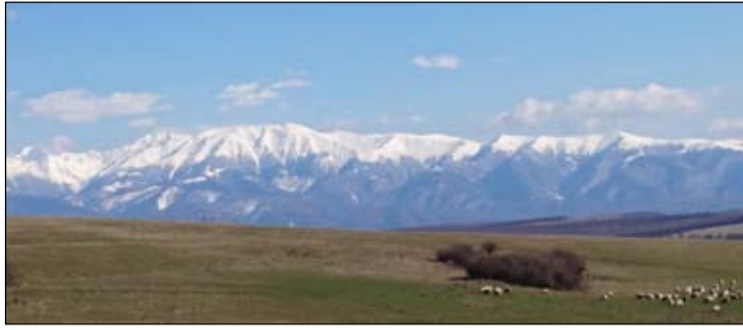
Ilyen és ehhez hasonló csodás tájakon át vezetett az utunk

Április 9.-én hajnalban elindultunk úti célunk felé. Első látványos helyszín a fölénk magasodó Déva vára volt. Egy rövid kis pihenő és egy megérdemelt tőprengés (a várról és történetéről) után folytattuk utunkat. Dévát elhagyva a csapat minden tagja kezdett felélnélni az egyre látványosabb magas hegyek tejetjén lévő hősapkák látványától. Először csak a Retyezát távoli csúcsait pillanthattuk meg, de