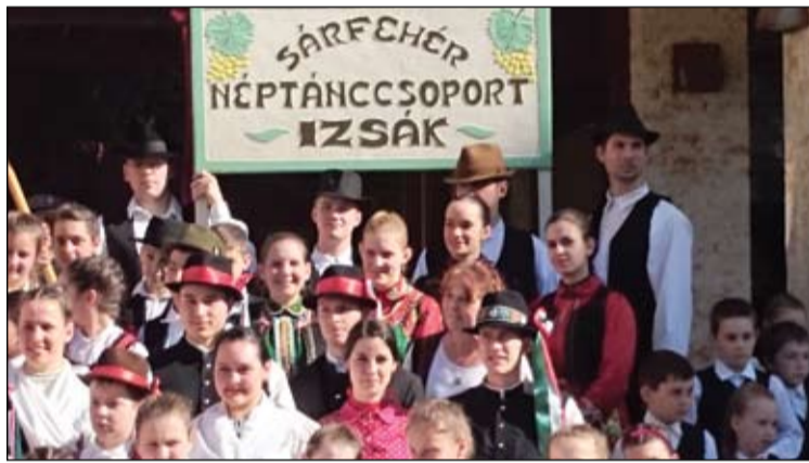
Csoportunk a Székelyföldi vendégszereplésen

nemsokára a Fogaras felső egyharmadát borító hófödte hegytető látványa is hihetetlen szép és felejthetetlen élményben részesített mindannyiunkat. Nem is hagyhattuk ki, hogy egy áprilisi hógolyózást és egy kis hangulatos pihenőt ne tartsunk.