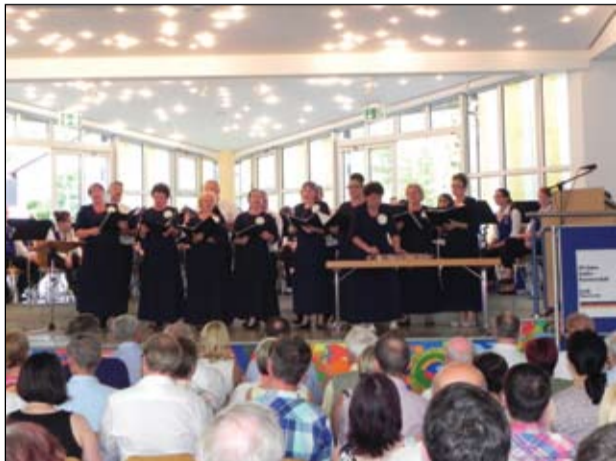
A Városi Vegyeskar nagyszerű élményben részesítette a vendéglátókat, műsorukat vastappsal köszönték meg

Az idei immár a huszadik éve annak, hogy kölcsönös látogatásokon találkozzunk német testvérvárosunk, Strullendorf lakóival. Egyik évben ők tesznek, másik évben mi teszünk látogatást. Idén mi látogattunk Strullendorfba. Delegációnk tagjai az Izsáki Sárfehér Néptánc Együttes, a Városi Vegyeskar és a vendéglátócsaládokból állt. Látogatásunk július 2-ától