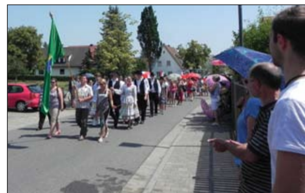
Az izsáki delegáció felvonulását az városi zászlóval vezették

Ezúton mondok köszönetet a Strullendorfban járt izsáki delegáció tagjainak, a fellépő szereplőknek mindazért a teljesítményért, mely okán joggal érezhettük úgy, hogy jó volt Strullendorfban izsákinak lenni!