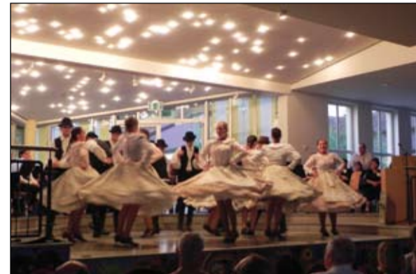
A Sárfehér Néptánc Együttes fergeteges műsorrát élénk tetszéssel fogadták a strullendorfiak. Annnyira tetszett műsoruk, hogy később a vendéglátók maguk is kipróbálták néhány magyaros tánclepet