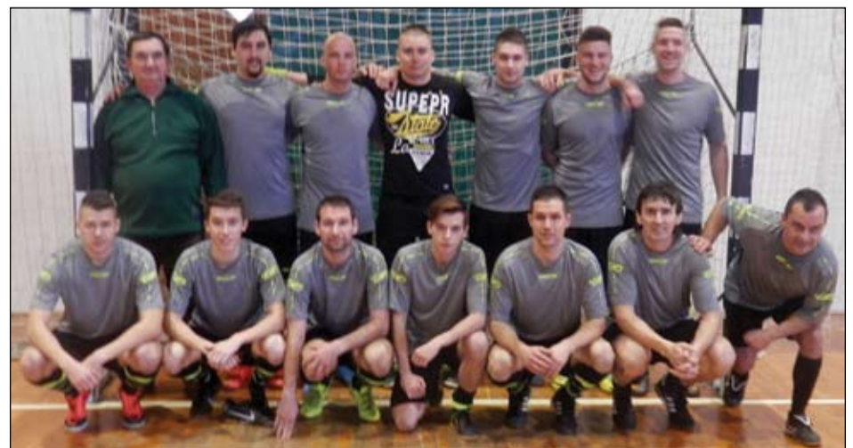
Izsáki felnőtt csapat