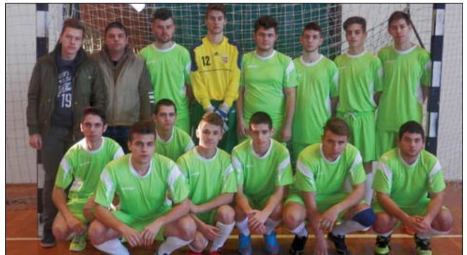
Izsáki ifi csapat

na) mellett, ez is sportbaráti kapcsolatok, valamint a téli, felkészülési időszakhoz kapcsolódó sportolási lehetőség biztosítását célozta meg. A különbség az, hogy míg a Topa Kupában csak 40 éven felüliek szerepelhetnek, a Gedeon Birtok Kupán már nem volt alsó korhatár.