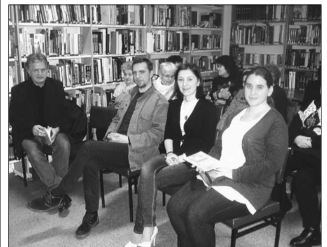
A szerző (középen), könyve izsáki bemutatóján

A gondolataidba, a bánatodba, a fájdalomidba, az önsajnálattal, mindenbe, ami árt Neked és ezáltal Neki is. Hallod, hogy sír? Segítségért kiált. Ne gondold, hogy megbolondultam! Én hallok a lélekpillangókat. - írja a szerző azzal a szándékkal, hogy mások is meghallják a sajátjukat és pillangó-