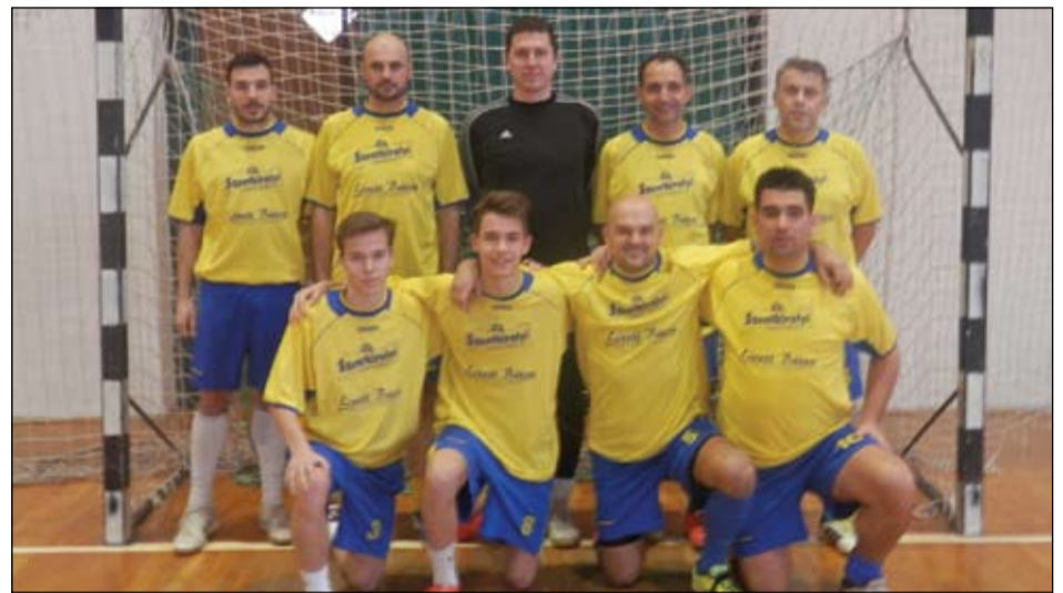
A bajnok Ágasegyháza csapata