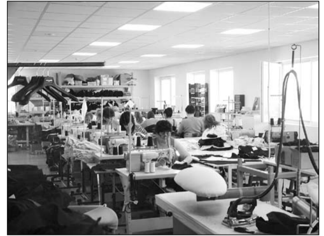
Korszerű szabásati és varrógépek mellett húsz fő állítja elő a minőségi ruházati termékeket

- Elmondhatom, jó gárdánk jött össze, és ezt nem udvariasságból mondom, tényleg ez a valóság. Örömmel vesszük azt is, hogy egymásnak ajánlották, ide érdemes eljönni dolgozni. Ebből az is következik, hogy ők is elégedettek velünk.