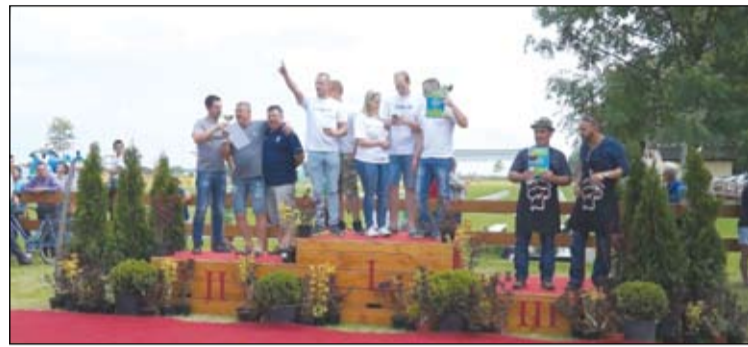
A birkapörkölt főző verseny helyezettei

A II. Kolon Távlovas és Távhajtó Kupán harmincan álltak rajthoz, köztük a sportág ismert versenyzői, valamint fiatal reménységek. 20 és 40 kilométeres távokon versengtek a résztvevők.