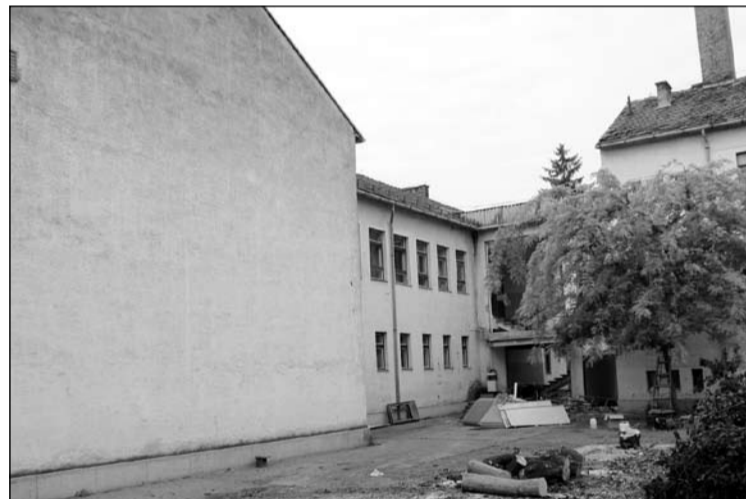
Az udvar immár a megszokott fák nélkül