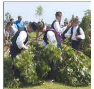
A Sárfehér Néptánc Együttes tagjai kitáncolták, majd ledöntötték a májusfát