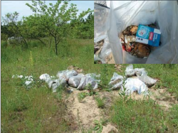
Két hete volt a terület feltisztítva, most így néz ki távolról, s közelebbről

...vagy inkább már jellemző? Nevezetesen az, hogy míg a városért a környezetért felelősséget érzők időt, fáradságot nem kímélve – nem ritkán undorukat leküzdve – összegyűjtik a mindenhol igen komoly mennyiségben szétdobált szemetet, addig vannak, akik nyilván hülyének nézve a fáradozókat, gond nélkül újra teli hordják a megtisztított területeket. Így történt ez most is. A Vadasban egy volt tanya helyéről óriási mennyiségű odahordott szemetet gyűjtöttek fel alig egy hónapja az önkéntesek. Két héttel később már újra kezdhették volna, mivel valaki tizenhét zsáknyi szeméttel csúfította el ismét az általuk gondosan megtisztított területet. Törött ablaküveg, autó szélvédő, sörös, tejfölös és tejes dobozok befőttes üvegek, nyesedék, s még sok egyéb hulladék éktelenkedik újra az egyébként nagyon szép természeti környezetben. Vajon mi munkál az olyan ember fejében, aki ilyet csinál? Ha már maga nem is tesz érte, legalább megbecsülné mások azon törekvését, hogy normális, emberhez méltó környezetben