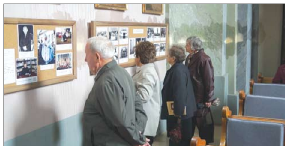
Az emlékkiállítás őszig várja a látogatókat

szolgálatának pillanatait idézik. A tárlat szeptember végéig, a templom Szent Mihály napi búcsújáig lesz látható a katolikus templomban. A centenáriumi alkalmából „Láttam a püspököt” címmel egy emlékkötet is megjelent,