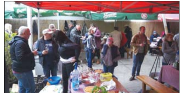
A hangulatot a rossz idő sem tudta elrontani

tával), Láng család (csilis taco), Ágasi Nem Adjuk Fel Nyugdíjas Klub (káposztás tészta), Legvidámabb csa-