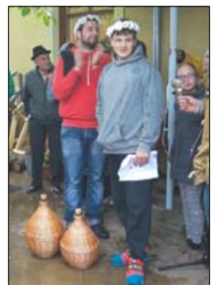
Felnőtt és gyermek pünkösdkirály 2016

tával), Láng család (csilis taco), Ágasi Nem Adjuk Fel Nyugdíjas Klub (káposztás tészta), Legvidámabb csa-