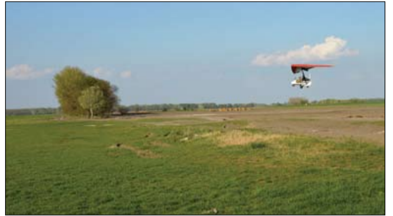
A sárkányrepülő, melyet a gémtelep lerepülésére használhattunk

Az 1920-as évek lecsapolásai előtt nagy gémtelpek lehettek a Kolon-tavon. A lecsapolások időszaka után a nádas csak az 1970-es évek közepére alakult vissza olyan állapotúvá, hogy alkalmassá vált a gémekek költésére. A Kiskunsági Nemzeti Park 1975-ben alakult meg, és a Kolon-tavat ekkor védett területté nyilvánították. Az akkori gémtelpeken nagy kócsag, bakcsó és kanalasgém költött, azóta egyre több gémfaj fészkel a tavon. Jelenleg az összes hazánkban költő gémféle költ. A zárt nádasban