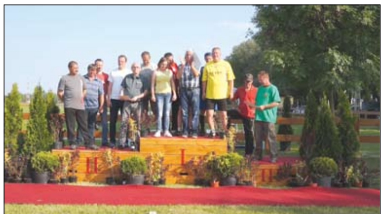
A kispályás focikupa helyezettei