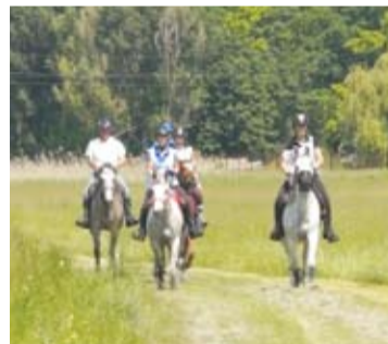
A távhajtók és távlovasok szép környezetben versengtek