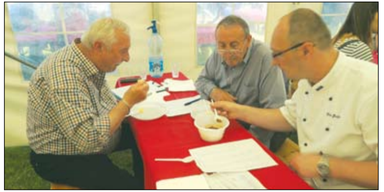
Munkában és gondban a főzőverseny zsűrije

Akik nem kívántak főzni, azok sem maradtak program nélkül, hiszen a Kolon Futó Kupa különböző távjain zajló versenyek komoly izgalmakat hoztak. A hagyományoknak megfelelően egészen kicsik, kicsit nagyobbak, még nagyobbak, s felnőttek álltak különböző korosztályokban rajthoz. Több min háromszázan vállalták a megmérettetést.