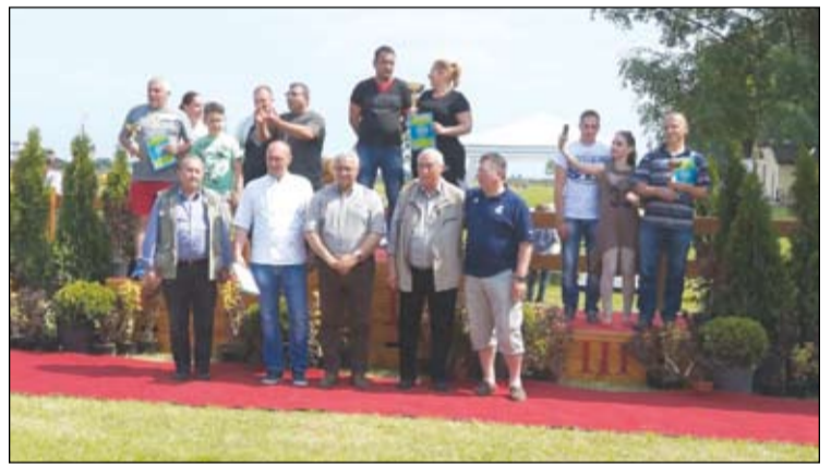
A marhapörköltfőző verseny helyezettei