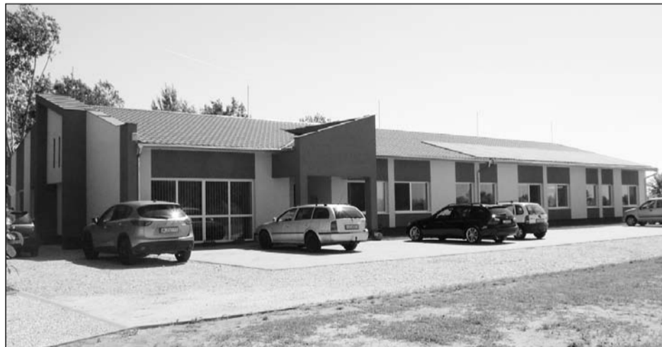
A volt gázcseretelep mögötti területen ma a Mille Moneta Kft. korszerű ruházati üzeme működik

markáknak dolgozunk, mint például az Azza-ro, Arrow, Kenzo, Carven, Bonton, Bonpoint, Cristophe Lemaire, és a Givenchy. Férfi télikabátokat, ballonkabátokat, nadrágokat, gyermek és lánykaruhákat készítünk. Az alapanyagot valamint a kellékeket a megrendelők biztosítják, mi pedig a kiváló munkát, szakértel-