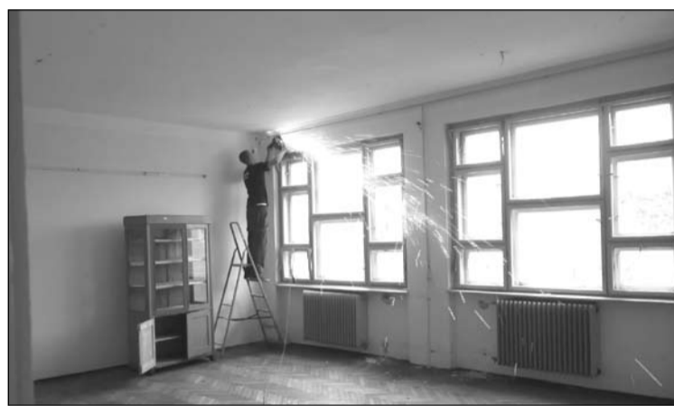
A bontási munkák a radiátorok és a fűtőcsövek eltávolításával kezdődtek meg

A bontási munkálatok az iskolaépület radiátorainak, fűtőcsöveinek, fémablakainak, portáljainak kiszerelemével kezdődtek meg, majd a fa nyílászárók kibontásával,