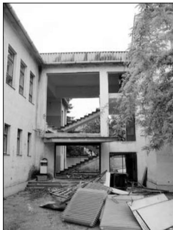
Az udvari bejárat kibontott ajtóval, portállal