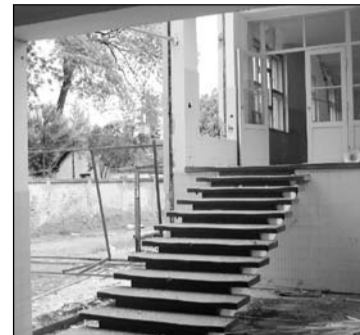
A zsigibogó oldalportálja és a lépcsőkorlátok már nincsenek

a tetőszerkezet és az épület teljes elbontásával folytatódik. Ezt követően indul az építkezés.