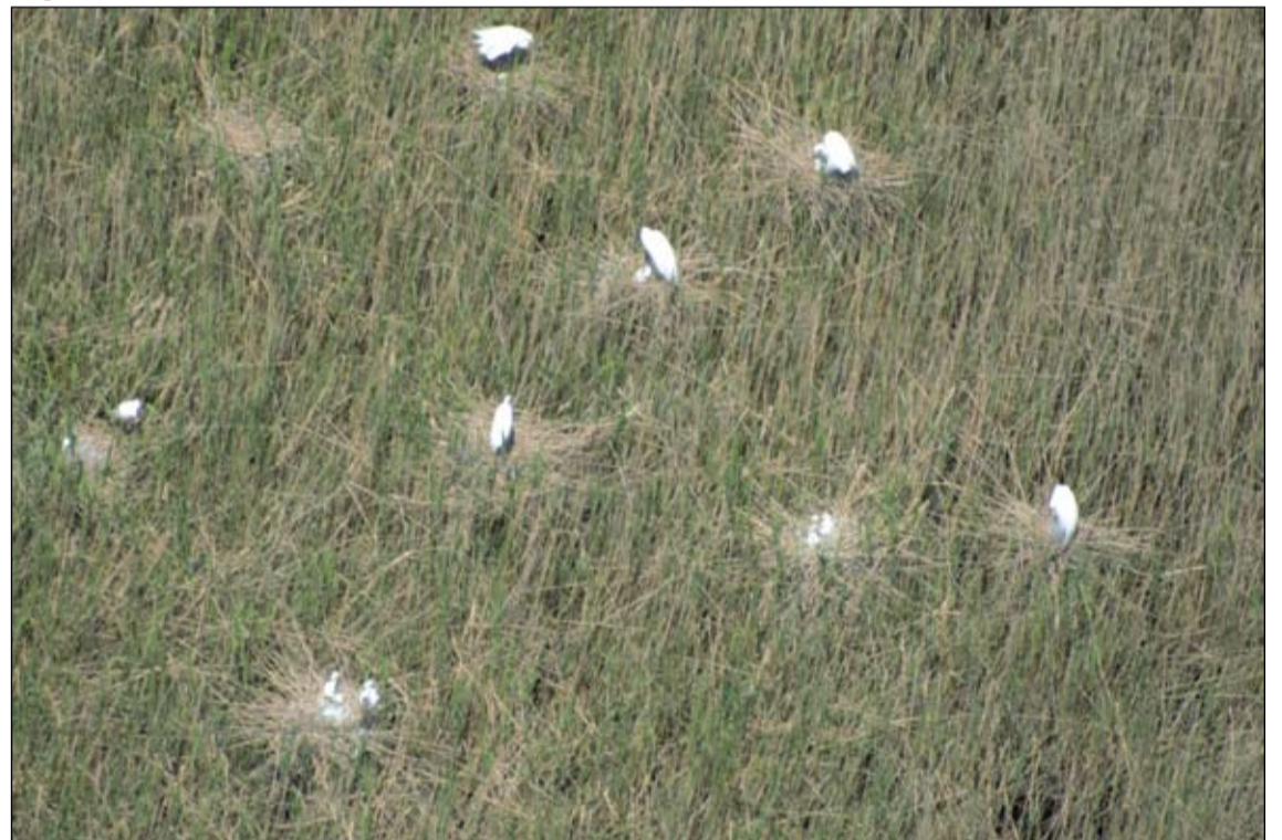
Nagy kócsag fészkek

A törpegém rendszeres fészkelő fajunk, amely elszórtan költ a nádasban. Kis termete és rejtett