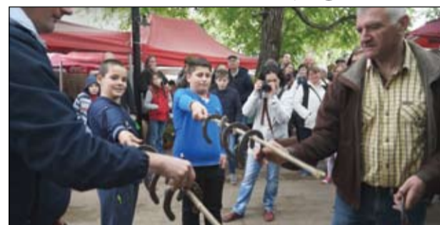
Ifjú pünkösdkirály jelöltek próbatétele