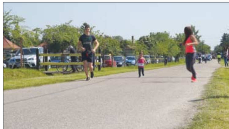
A legfiatalabb futó két és fél éves volt