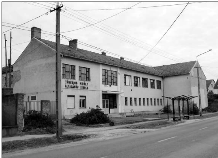
Bontásra várva – a fákat már kivágták

a tetőszerkezet és az épület teljes elbontásával folytatódik. Ezt követően indul az építkezés.