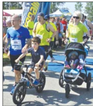
A futóversenyen különböző korosztályok különböző távokon állhattak rajthoz, volt, aki babáját tolvá futotta le távját

A szintén hagyományos kispályás focitorna eredménye. I. Izsáki Öregfiúk. II. Hivatal. III. Zöld Nefejejcs.