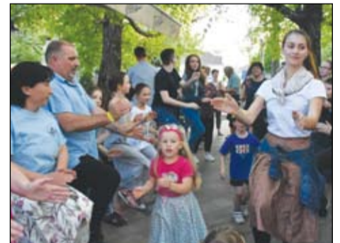
A főzés mellett jutott idő és energia a táncra is

goztak, s dél körülre el is készültek az ételek, amelyeket a zsűrizés előtt Bajkó Zoltán plébános szentelt meg a következő idézettel és gondolatokkal: „A főzés könnyű fejet, nyitott lelket és meleg szí-