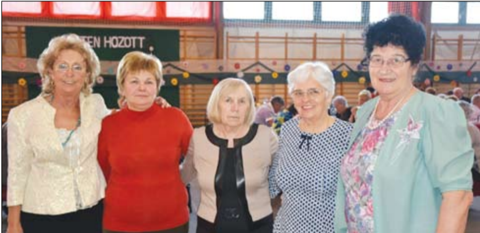
A résztvevő klubok vezetői

Az izsáki Ezüst Gólya Nyugdíjas Klub hosszú évek óta tavaszi találkozót szervez a környékbeli kluboknak. Az idei alkalomra április 14-én, hagyományosan a sportcsar-