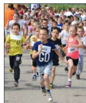
Ovisok és kisiskolások is futottak