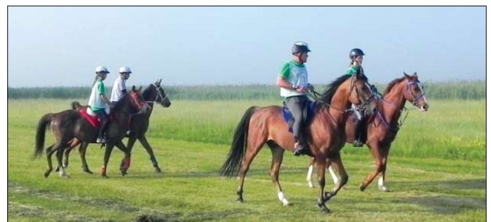
A távlovass verseny csodálatos környezetben zajlott