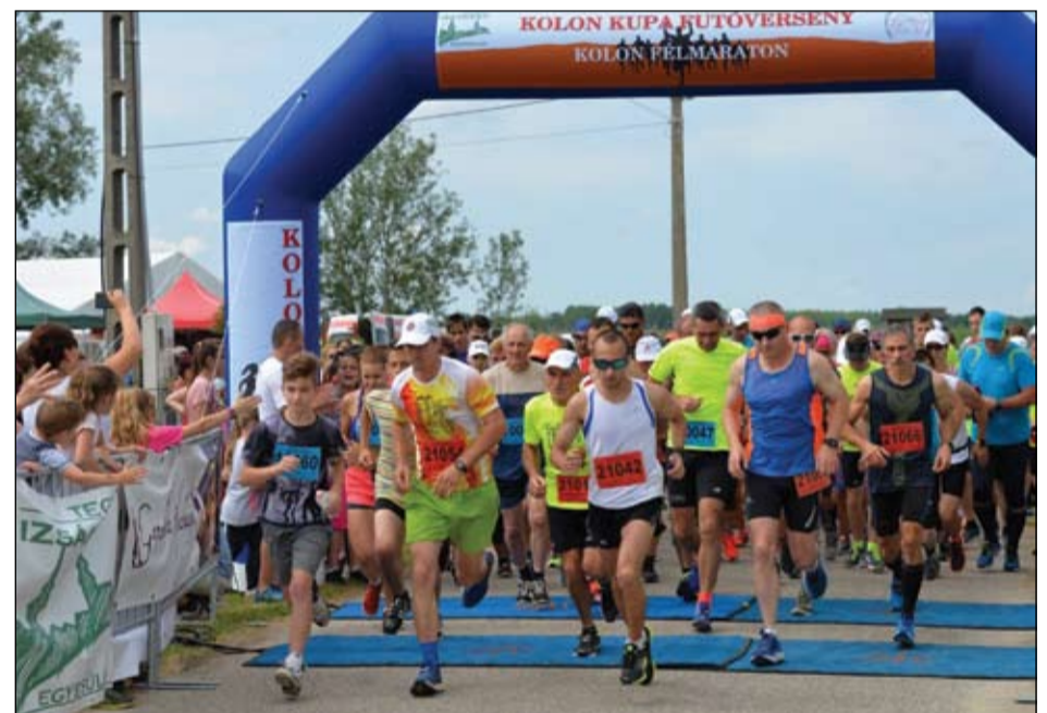
A futóversenyen háromszáznál többen álltak rajthoz

„Három az egyben”- akár ezzel a szlogennel is jellemezhetnénk az idén negyedszer megrendezett izsáki majális, hiszen most is három programból állt össze az immár hagyományosnak nevezhető alkalom. Idén az időjárás is kedvezett, így óriási tömeg jött össze május 26-án a fogathajtó pályán. Bár, mint tudjuk, a tavalyi rossz idő sem szegte igazán kedvét az érdeklődőknek, hiszen akkor is igen sokan voltak. Mindezek azt bizonyítják, hogy jó