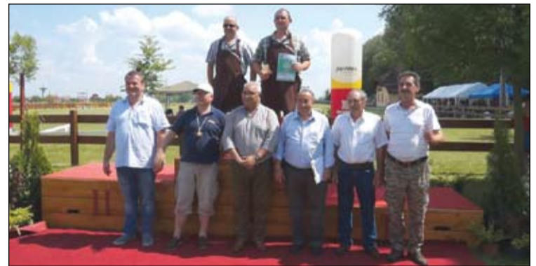
A legkreatívabb főzőcsapat

seny része a Bács-KisRUN 2018 versenysorozatnak, melyben négy különböző versenyen való részvétel után érmet kapnak a résztvevők. A különböző kategóriák és korosztályok eredményhirdetésekor sokan örülhettek, köztük több izsáki versenyző is dobogóra állhatott. A részletes eredmények a Kolon Futóklub honlapján érhetők el.