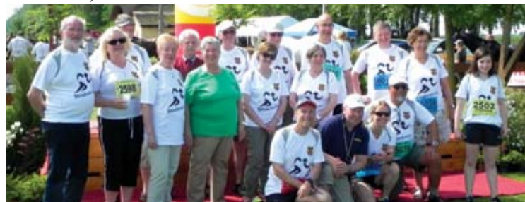
Strullendorfi vendégeink is részt vettek a majálison, ki főzött, ki focizott, ki futott