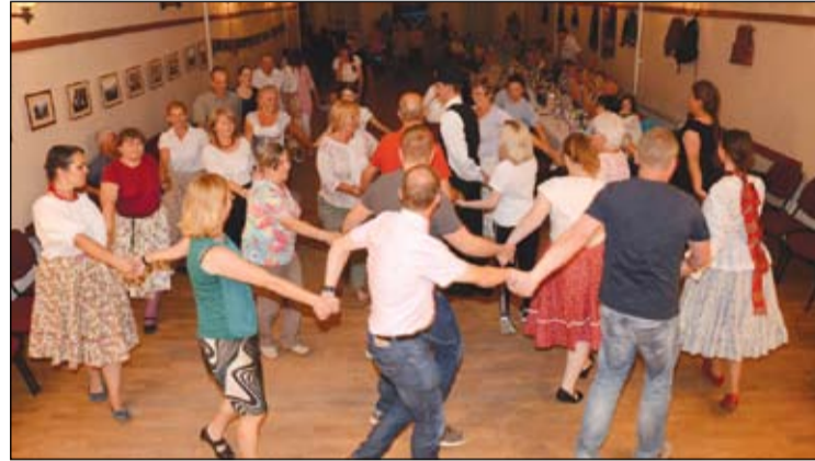
A Sárfehér Néptánc Egyesület vacsorával egybekötött táncszóróval köszöntötte német vendégeinket, akik szívesen gyakorolták a magyar tánclelőzéseket

egy hosszú és stabil barátság kezdete volt. Azóta minden esztendőben találkoznak a két település egymáshoz látogató csoportjai. E találkozások igazán barátiak, ami igen örömteli tény, hiszen a testvérkapcsolat lényege éppen az, hogy minél több baráti szál szövődjék a két település lakói között. Ezt erősíti az a hagyomány is, hogy mindkét helyen családok látják