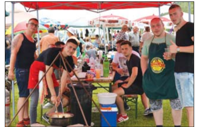
Családi, baráti társaságok főztek igen jó hangulatban

„Három az egyben”- akár ezzel a szlogennel is jellemezhetnénk az idén negyedszer megrendezett izsáki majális, hiszen most is három programból állt össze az immár hagyományosnak nevezhető alkalom. Idén az időjárás is kedvezett, így óriási tömeg jött össze május 26-án a fogathajtó pályán. Bár, mint tudjuk, a tavalyi rossz idő sem szegte igazán kedvét az érdeklődőknek, hiszen akkor is igen sokan voltak. Mindezek azt bizonyítják, hogy jó