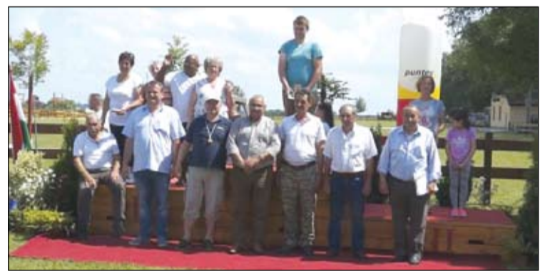
A győztes marhapörkölt főzők

A majális „futó szekciójában”, a Tegyük Izsákért Egyesület és a Városi Gyermekjóléti és Családsegítő Szolgálat együttműködésében megrendezett XI. Kolon Kupa Futóversenyen az ovis korosztálytól a +60 korosztályig bezárólag közel háromszázhatvanan álltak rajthoz, a 300, 800, 2500, 5000 méteres és a 10 kilométeres félmaraton távokon. Gyermek kategóriában összesen 36 óvodás és 94 alsó tagozatos iskolás állt rajthoz. A hosszabb, felnőtt távokon 225 futó vett részt. A versenyzők helyből és vidékről is érkeztek, hiszen az izsáki ver-