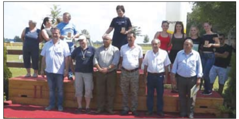
A győztes birkapörkölt főzők