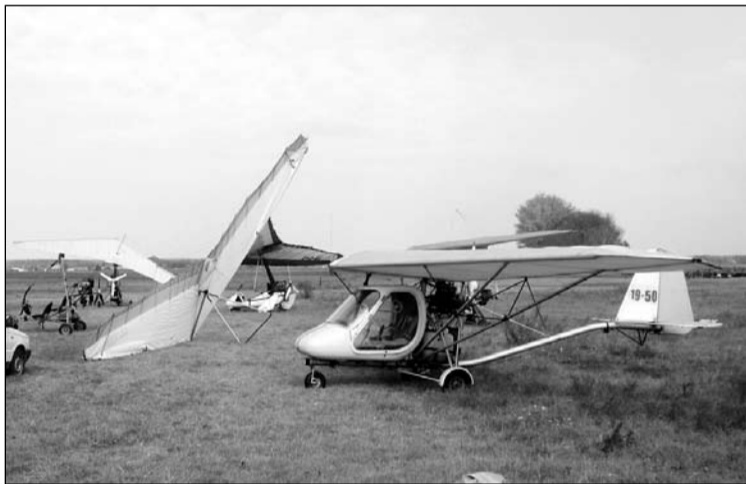
Reptéri „csendélet” repülővel, sárkányokkal

Nyilván azokban, akik nem repülnek, felmerül a kérdés, mi a jó valójában a repülésben. Ezt nem szavakkal, hanem a repülés konkrét megtapasztalásával lehet igazán megmutatni. Sokakat