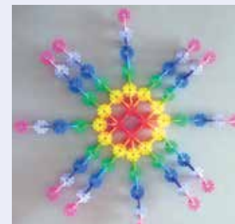
Gyallai Nóra 5.a