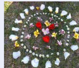
Bognár Zsófi 3.b