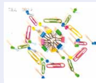
Fábián Villő 5.b két mandalát is készített