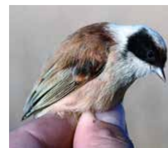
A függőcinege kis számban áttelel, de az állomány nagyobbik része a Mediterráneumban tölti ezt az időszakot. Gyakori őszi-tavaszi vendég és kisszámú fészkelő a Kolon-tavon

az eddig bevett gyakorlatot. A madárgyűrűzéseket kizárólag egy-három fő részvételével tudjuk elvégezni, ami magával vonja az eddigi stratégia megváltoztatását is. A kialakult helyzet ellenére igyekszünk a mintavételeket elvégezni, de mindig csak egy-egy kisebb szakaszt vizsgálva. Így amennyiben komolyabb korlátozások nem lépnek érvénybe, ha nem is a megszokott módon, de a kutatásokat folytatni tudnánk.