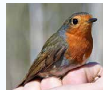
A vörösbegy kis számban fészkel a Kolon-tó körüli erdőkben, bokrosokban. A telet a Mediterráneumban tölti, gyakori és nagyszámú őszi-tavaszi vonuló

sen helyezkedik el, mely 1500 méteres hosszúságával Európa leghosszabb egybefüggő hálóállása. Éppen ezért üzemeltetése komoly szervezést és megfelelő létszámú madárgyűrűzőt és segítőket igényel. A tavaszi időszakban a költési hazaérkező madaraink zavartalanosságának biztosítása érdekében kéthetente egy gyűrűzési napon szoktuk a vizsgálatot elvégezni. Ekkor a tó teljes keresztmetszetén egyidejűleg jelöljük a madarokat. Ezt a 2006-ban elindított programunkat az időjárási körülményekhez igazodva, de évről évre ugyanúgy végezzük, ezáltal egymással összehasonlítható adatokat kapunk. Az idei évben kialakult járványügyi helyzet sajnos felülírta