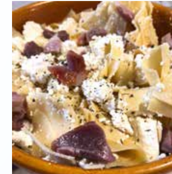
Papp-Gyulai Brigitta csülkös csuszája igazi kuriózum