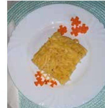
Czira Nelli Mac'n Chees ételle igen elegáns