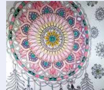
Tercsi Szabina 5.c