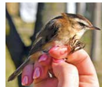
A fülemülesítke a Kolon-tavi Madárvárta címermadara. Március elején érkezik meg a Földközi-tenger partvidékéről. Állománya csökken, a Kolon-tó rendkívül fontos élőhelye

A madárgyűrűzés már több mint száz éves múltra visszatekintő természetvédelmi célú kutatás, mely a madarak egyedi sorszámmal ellátott gyűrűvel történő jelölésén alapul. Fontos ez, hisz számos rejtettebb életmódú madarunk állomány nagyságáról, szaporodási sikeréről, élőhely-választási szokásairól másképp nem tudnánk pontos adatokat gyűjteni. Védelmük érdekében tudnunk kell, hogy állományuk hogyan változik, vonulásuk során merre járnak, és hol töltik a telet. A tudományos és természetvédelmi célú kutatások mellett a madárgyűrűzési bemutatók fontos szerepet töltenek be a környezeti nevelésben, természetvédelmi oktatásban.